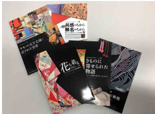
過去の展覧会図録はミュージアムで閲覧できる他、図書館にも所蔵されているので、ぜひご覧ください。 展覧会の開催中は、来館者に無料でお配りしています。