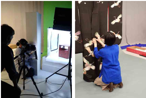
情報メディア学科の協力を得て、MM館地下のスタジオ「Studio M+」を使用しています。