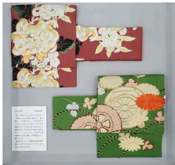
左：名古屋帯 中央：裁縫雛形 右：絵更紗の袋物

10月に IR 館1階の常設展示コーナーを展示替えしました。展示替えは季節に合わせたものを心がけています。今回は、登録有形民俗文化財の中から「名古屋帯」「裁縫雛形」「絵更紗の袋物」を展示しています。「名古屋帯」は昭和戦前期のものです。菊の文様を集めました。「裁縫雛形」は実物を正確に縮小したミニチュア制作物で、明治期に東京家政大学の創立者である渡辺辰五郎(1844-1907)によって考案されました。短い期間に多種類の裁ち縫いを学ぶことができます。「絵更紗の袋物」は昭和45年ごろから竹尾千代が制作したものです。絵更紗の創始者である元井三門里(1885-1956)の参考書を模倣して制作しています。