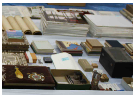
調査済み資料を並べる