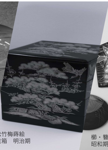
松竹梅蒔絵 重箱 明治期