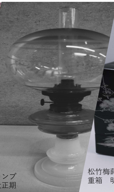
オイルランプ 明治～大正期