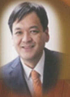
油井 宏隆 バリトン