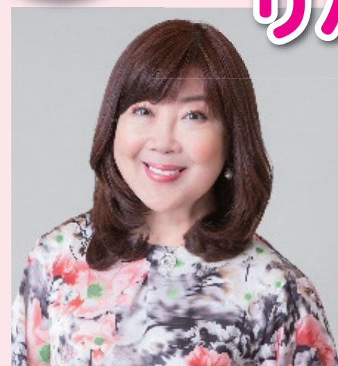
フェイシャルセラピスト かづきれいこ 氏