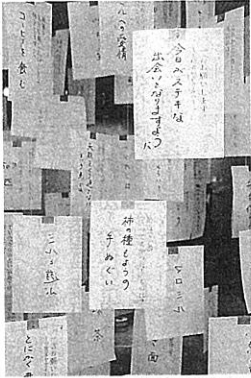
湊さんが自筆で答えた100個のQ&A